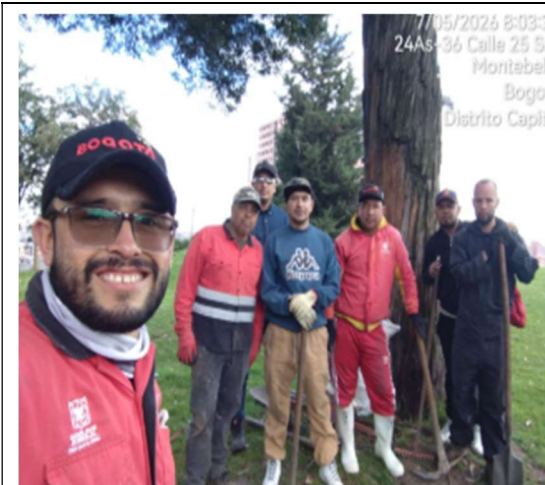
Fotografía 1. Inicio jornada mantenimiento de jardinería barrio San Blas KR 3 con CL 18 Sur