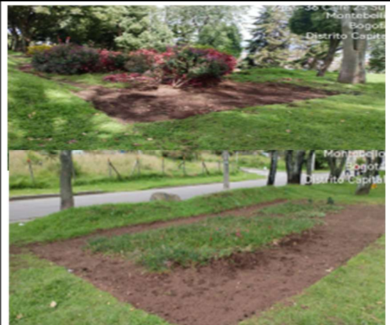
Fotografía 3. Posterior a la intervención en la jardinería.