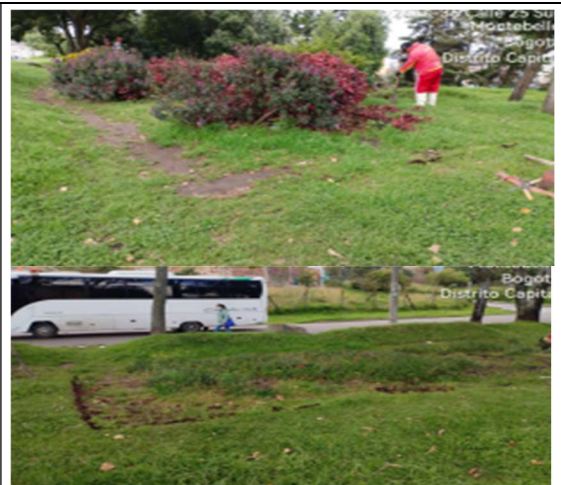
Fotografía 2. Antes de la intervención.